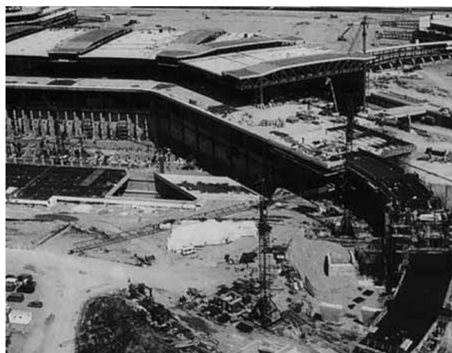
Malpensa 2000. Impermeabilizzazioni degli accessi carrabili all'aerostazione.